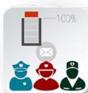
ALERTAS DE Exceso de Aforo