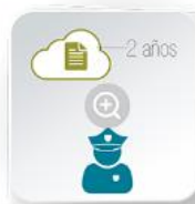
REGISTRO OFICIAL de Datos