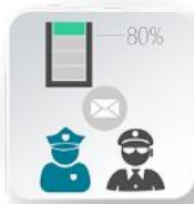
AVISOS de Ocupación

Los servicios de ALERTA y EMERGENCIAS no están sometidos a control metroológico estatal, posibilitando a las Administraciones Públicas la decisión sobre el modelo de alertas y volcado de datos con fines preventivos y estadísticos